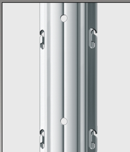
Face avant avec perçage pour pose accessoires